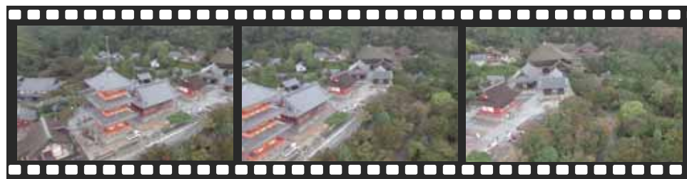
清水寺の 空撮動画