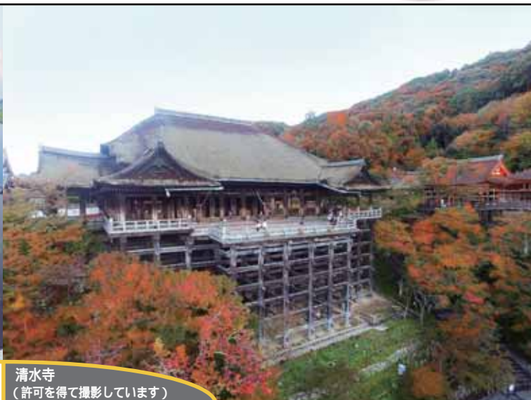
清水寺 (許可を得て撮影しています)