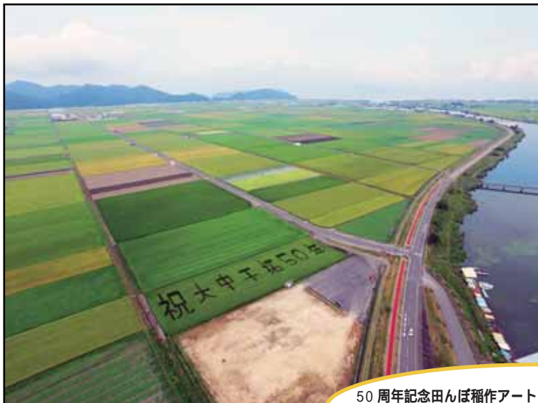
50周年記念田んぼ稲作アート