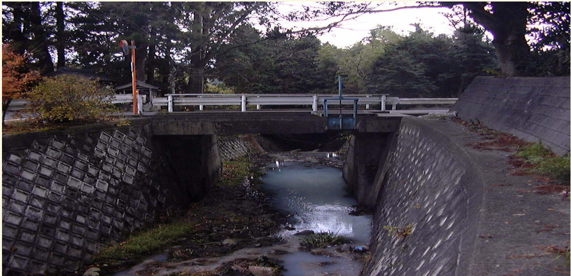
施工場所：滋賀県下